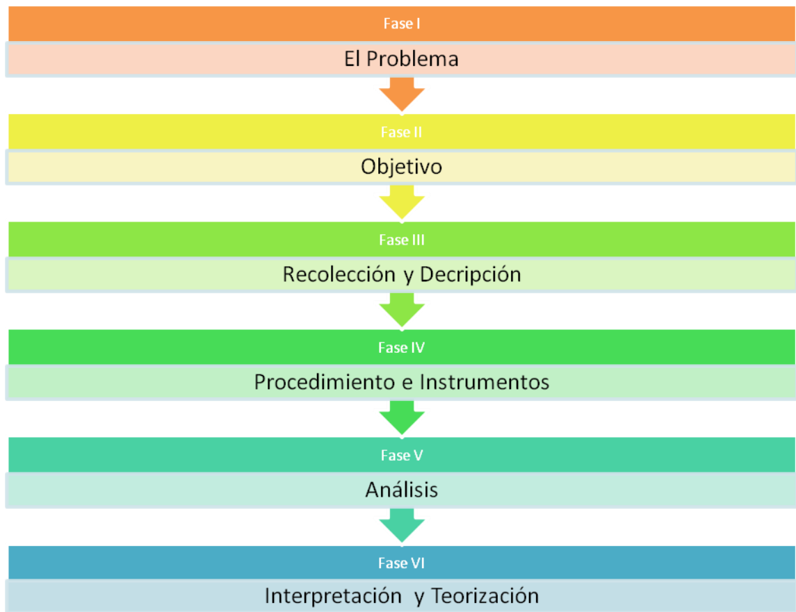
Gráfico N. 9 Fases de la Etnografía según Martínez.

A continuación se mostrara un gráfico con las fases de la etnografía propuesta por Miguel Martínez (1998):