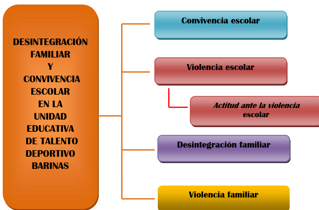
Gráfico 1. Representación gráfica de las categorías y sus dimensiones.

5. Luego se habilitó en el cuadro de la triangulación, una columna para las categorías y debajo de ella se indican sus propiedades, en letra cursiva.