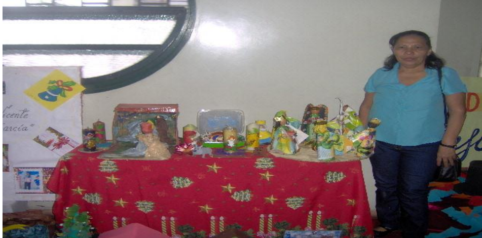
Imagen N° 4 Exposición de Nacimientos

fue presentada el día 14 de Diciembre 2014 fecha escogida para realizar el bazar navideño. (ver cuadro N° 7)