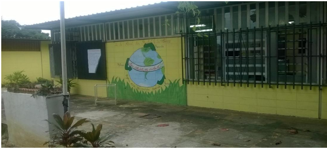
Imagen 1: Fachada del L. B. “Manuel Vicente Romero García”

Para ocuparse de la población estudiantil, se dispone de personal directivo conformado por un (1) director(a), dos (2) subdirectores(a), cuarenta y cinco (45) profesores, cuatro (4) coordinadores, cuatro (4) orientador(a), dos (2) especialistas en el área de cultura, siete (7) que corresponden al personal administrativo y seis (6) correspondientes al personal de ambiente.