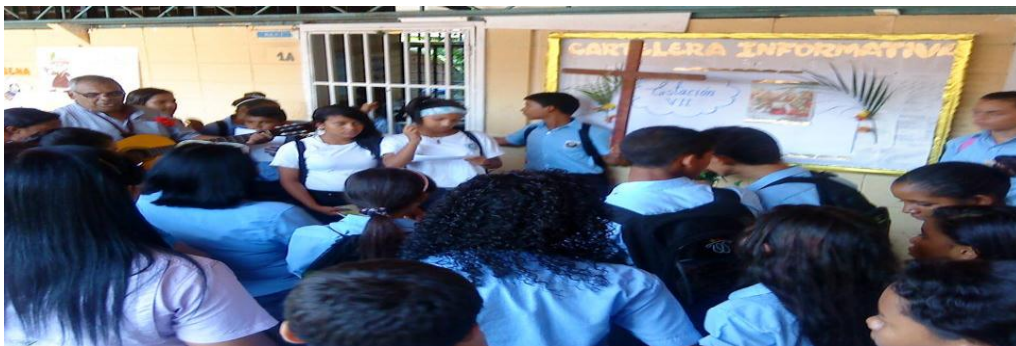
Imagen 8: Actividad del Vía Crucis

Además, se incorporó el Coordinador de Evaluación en el acompañamiento musical de las canciones alegóricas a la fecha y se realizó un recorrido por las casas cercanas al liceo, las cuales estaban adornadas con altares para recibir las estaciones. Ya dentro de las instalaciones del centro educativo, cada coordinación de seccional decoró la entrada con altares para continuar con el recorrido del vía crucis, culminando en la puerta de la dirección del plantel. En esta ocasión, los responsables no solamente fueron los organizadores sino que todo los que hacen vida en los alrededores del LBRM, la escuela vecina y la comunidad cercana, participaron en esta acción cultural, culminando con el recorrido por todo el plantel.