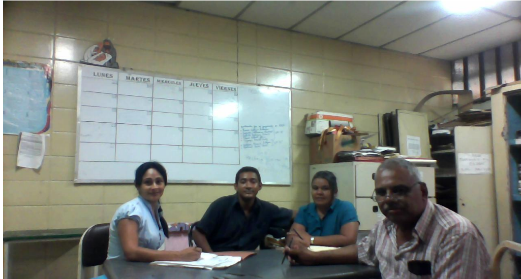
Imagen 2: Informantes Clave A, B y C