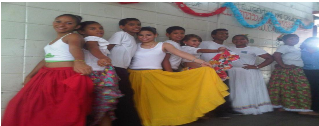
Imagen 10: Baile de San Juan Bautista

A pesar de esta programación los docentes en Ciencias Sociales y los especialistas tomaron la decisión de realizar la actividad de cierre de año escolar el día 10 de Julio con la participación de la actividad de danza con el sangreo y golpe de tambor en homenaje a San Juan Bautista manifestación que se realiza en las costas de Venezuela y que sirvió de cierre para el año escolar 2014-2015, es importante destacar que esta es la fase 3 de la IA en donde se ponen en práctica todo lo plasmado en el PA, cumpliendo con la característica de la fase 3 en cuanto a su flexibilidad pues la fechas se adecuaron a los cambios necesarios y al momento de los eventos se solventaron las situaciones inesperadas, aunque en línea general las programaciones se realizaron sin contratiempo.