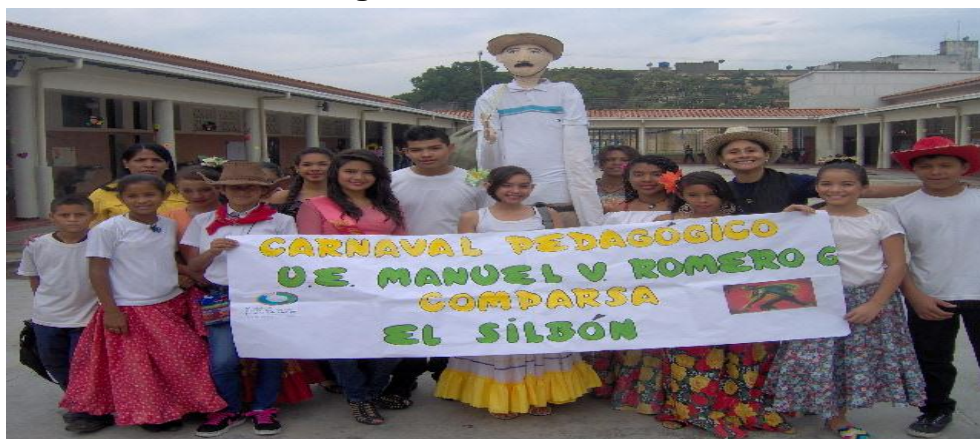
Imagen 7: Desfile de Carnaval

El día 14 de febrero, se participó en el desfile de carnaval programado por el Municipio Candelaria perteneciente a la Zona Educativa de Carabobo, en donde se partió desde la E.B.B. “República del Perú” con la representación de la leyenda “El Silbón”. En este, los docentes responsables se abocaron a participar y ser corresponsables de los estudiantes que iban en el desfile, más los representantes que acompañaban a sus hijos. En esta actividad también participaron los representantes del comedor escolar con el refrigerio para todos los participantes de la actividad.