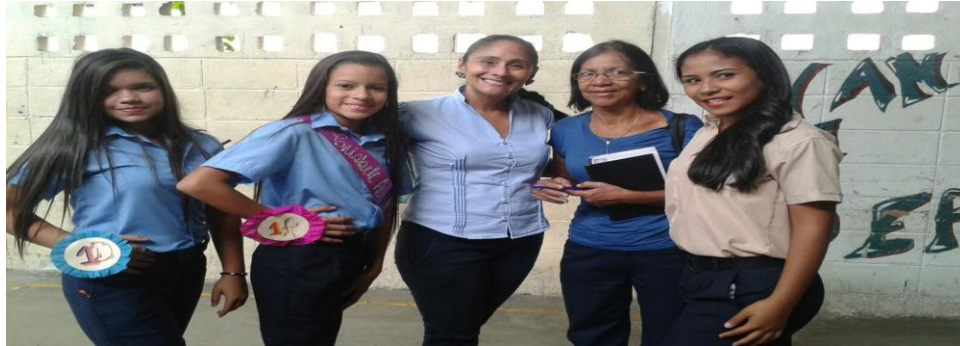
Imagen N° 6 Elección de la madrina