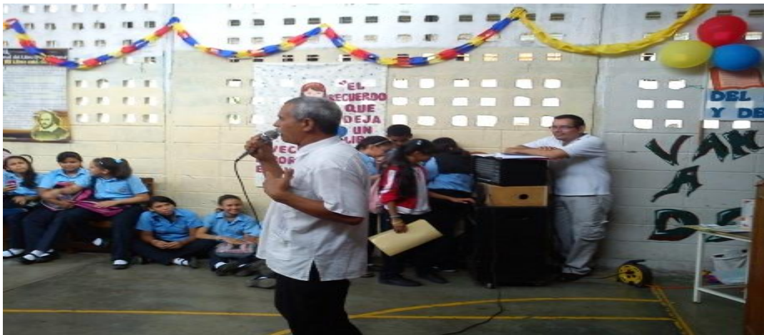
Imagen 9: Semana Aniversario del L.B. “M.V. Romero García”

Luego, en fecha 14 de Abril, se coordinó la siguiente reunión de profesores para medir los resultados de la actividad anterior, para lo cual se elaboró un informe de logros de estos dos trimestres de gestión cultural. En consenso entre los docentes de Ciencias Sociales, la idea es continuar con el desarrollo y participación en el Plan de Acción cultural; en esta misma reunión, se informó la fecha de la siguiente actividad para el día 15 de mayo, la cual consiste en la integración de varias actividades como el día de la madre, semana aniversario del liceo y velorio de cruz, pero al tomar en cuenta las fechas de las evaluaciones programadas por ese departamento, se corrió la fecha para el día 29 de mayo, día en el cual se realizó la actividad con la participación de padres y representantes.