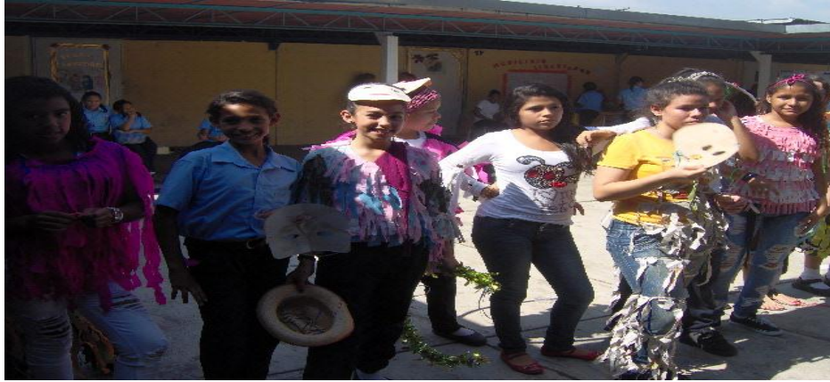
Imagen N° 5 Baile de la Zaragoza