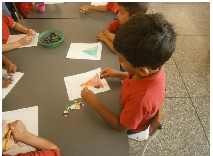
Actividades de expresión plástica