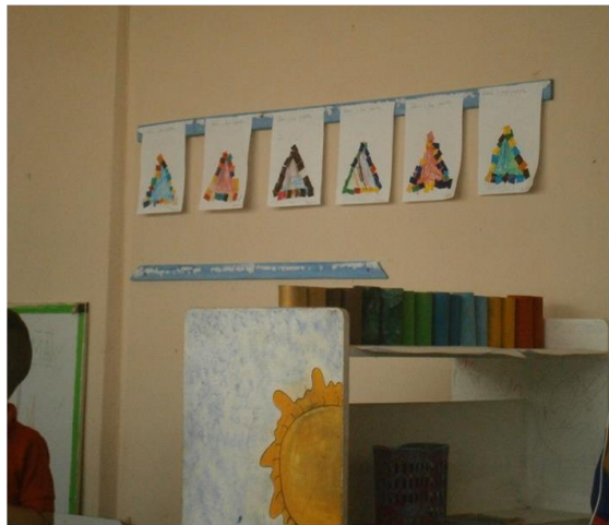
Actividades de expresión plástica