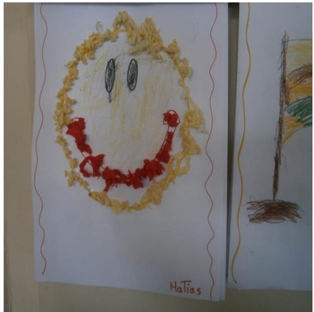
Actividades de expresion plastica