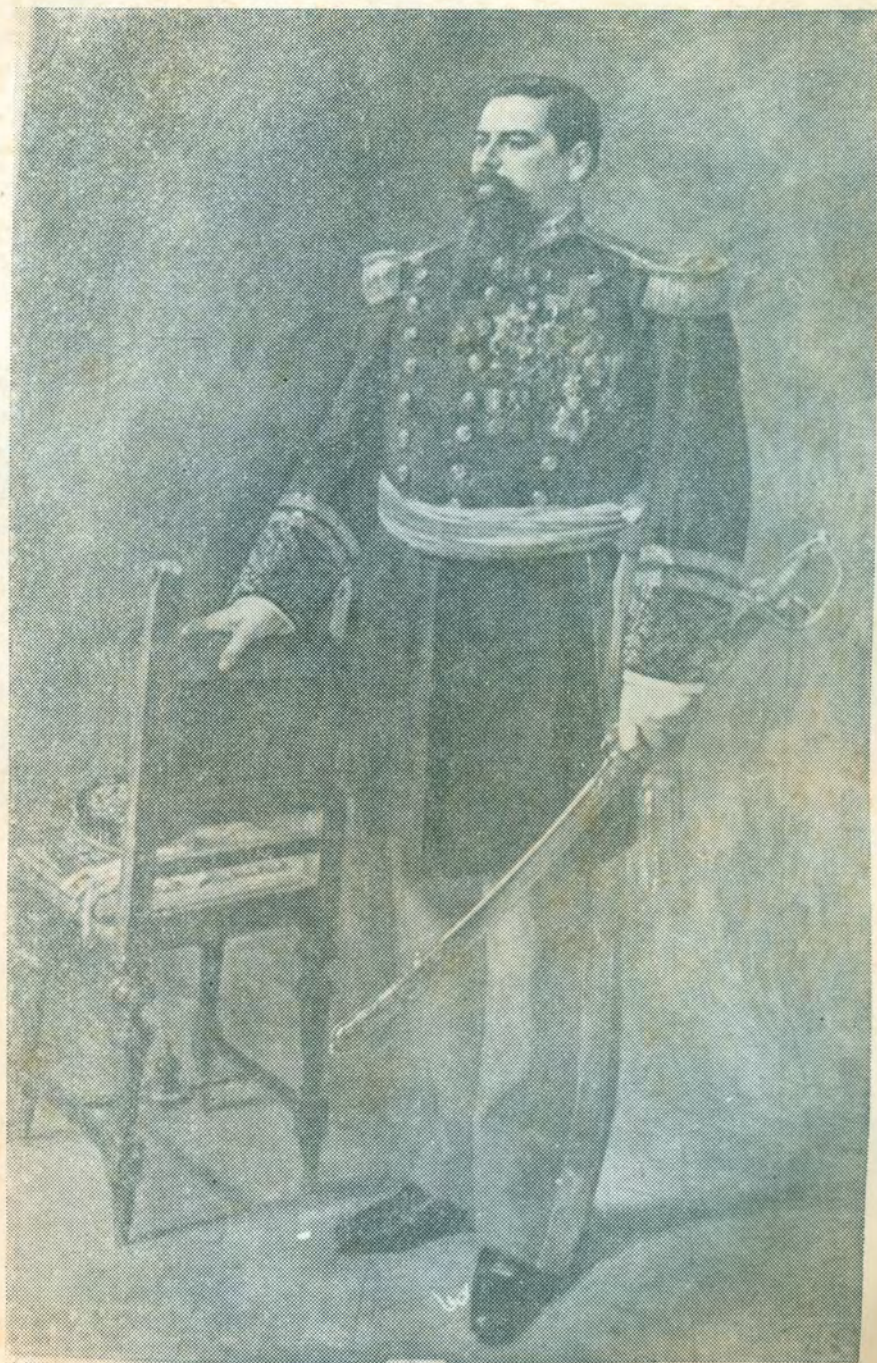
GENERAL JOAQUÍN CRESPO

Creador de la Universidad de Venezuela. Cónsul de Arturo Michelena